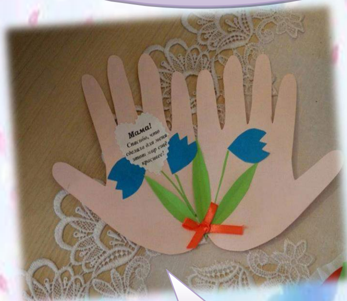
Саша и Ваня

Огромное спасибо всем ребятам за то, что показали, какие необычные цветы подарили своим приемным мамам. Вы молодцы!