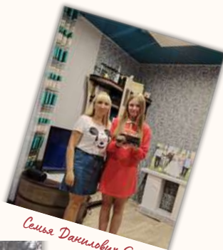
Семья Даниловых Е.И.